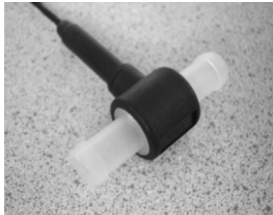
Typ S8.5PFA-H: 0,8 - 18 l/min