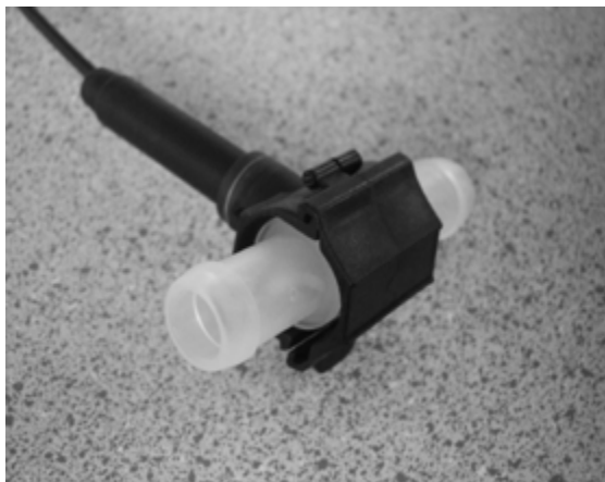
Typ S8.5PFA-D „Click-Sensor“