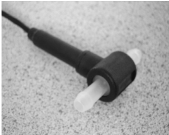
Typ S4.5PFA-H: 0,13 - 1,1 l/min