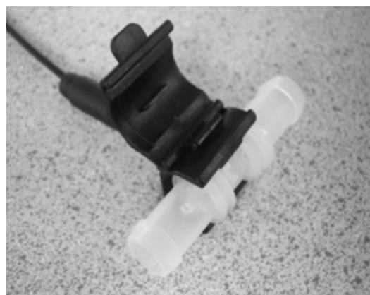
Vielseitig: Der Einweg - Clicksensor